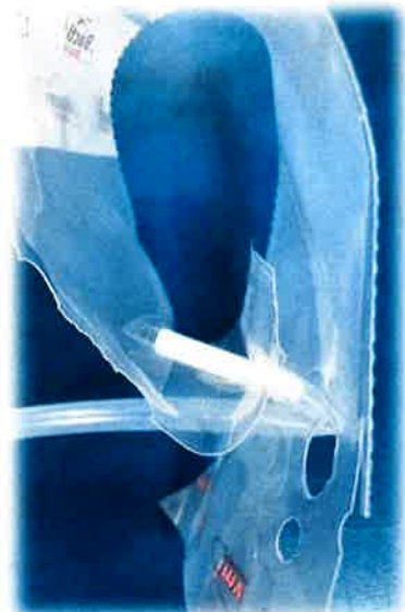
⑤パックの穴を通し、逆流を防止する