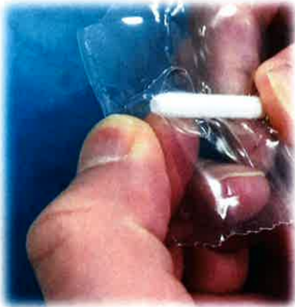
①注入口を開けるため、 注入口周辺のフィルムを引っ張る