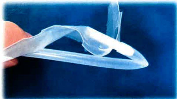
④カテーテルの末端を折り曲げる