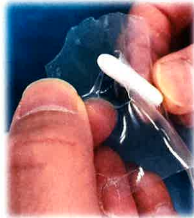
②フィルムが破け、注入口が露出する