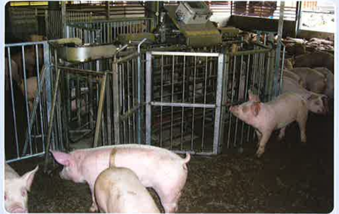
おがこ豚舎での使用例