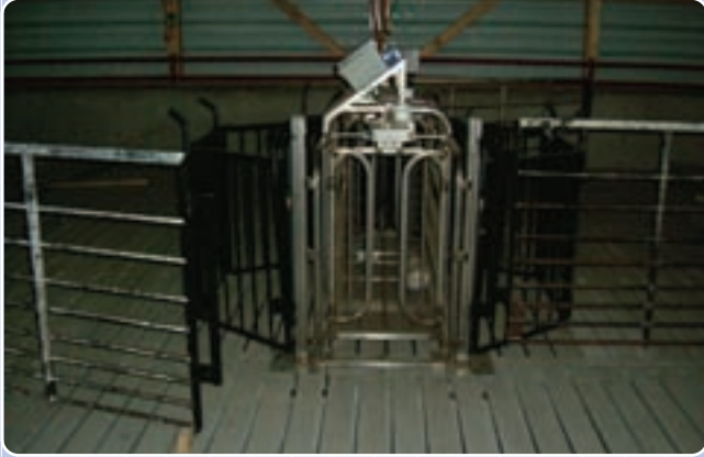
すのこ豚舎での使用例