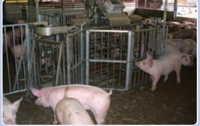
おがこ豚舎での使用例