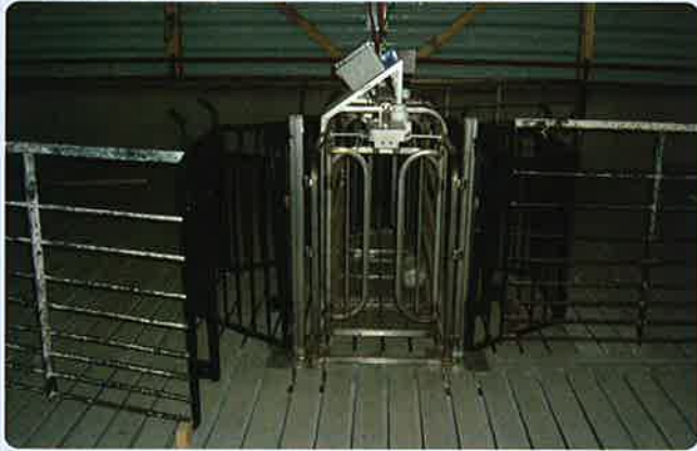
すのこ豚舎での使用例