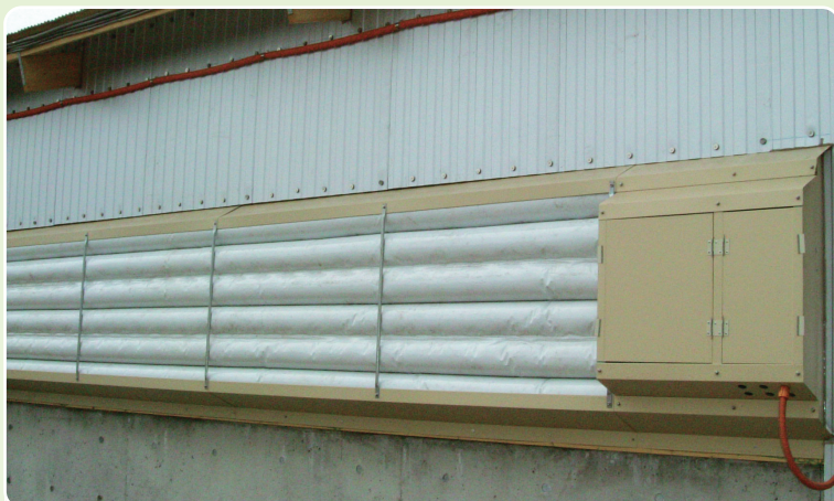
畜舎外側取付状況