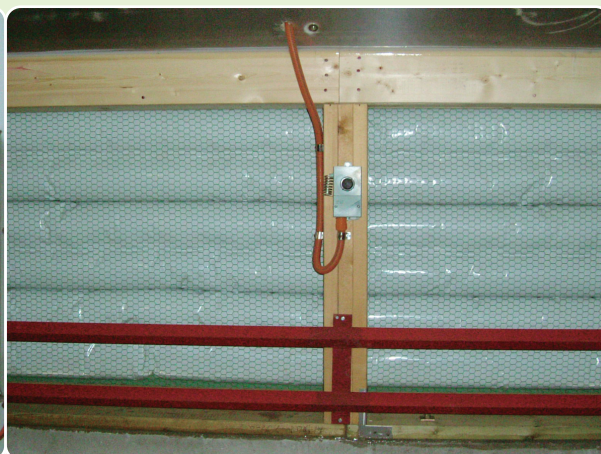
畜舎内側取付状況