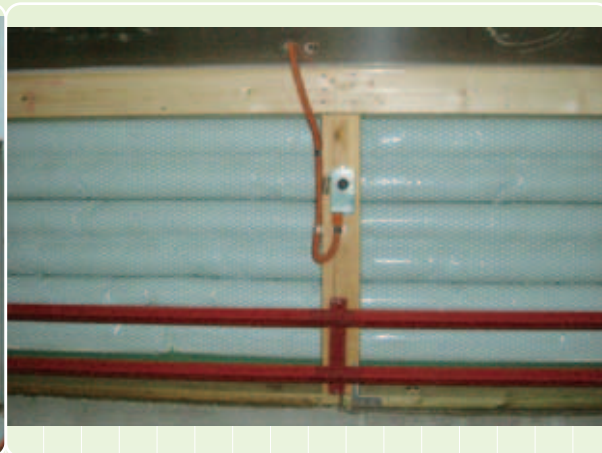
畜舎内側取付状況