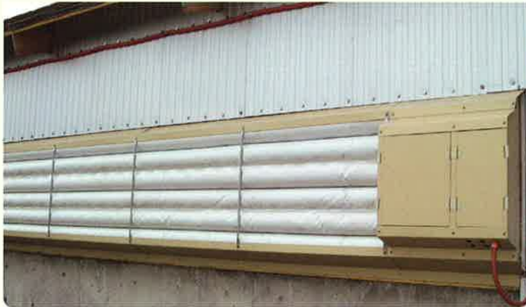
畜舎外側取付状況