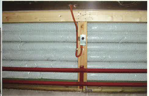
畜舎内側取付状況