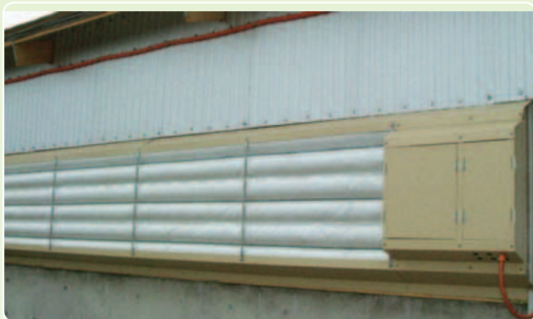
畜舎外側取付状況