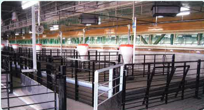
C2000インレットの設置状況(天井入気)